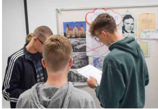
↑ Schüler arbeiten an einer Präsentation über die Biografie des Arztes Horst Schumann

Die für den Projektunterricht benötigten Unterlagen und Arbeitsmaterialien werden von der